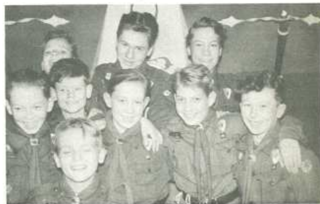
Spejderpatruljen, den ubrydelige enhed, kammeratskabet med de eventyrlige oplevelser.

Nu havde vi håbet, at dette skulle gå upåagtet hen og vi hørte da heller ikke noget, før vi kom på sommerlejr på Høn. Her skulle vi nemlig prøve at bygge både efter nøjagtig samme mønster, som på hin minderige mandagssøndag. Alt var i orden til vi skulle til at sætte skuden. Så udbød vores tropfører: "Har I døbt fartøjet - ellers vil jeg foreslå navnet DYK-ÆNDEN. Tank, at han havde kunnet holde mund med det, han vidste, i så lang tid!!!