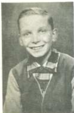
Gråbror, en af stammens 60 friske og frejdige ulveunger.

Jeg har ikke taget skade af spejderlivet!